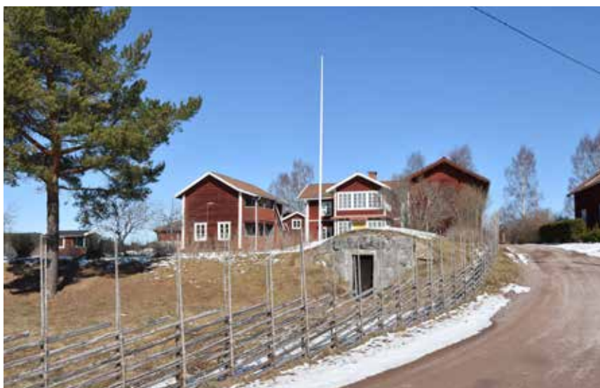
Gård med ovanligt stor källarstuga (till vänster), som har profilsågade detaljer på bron. Heden 3:26.