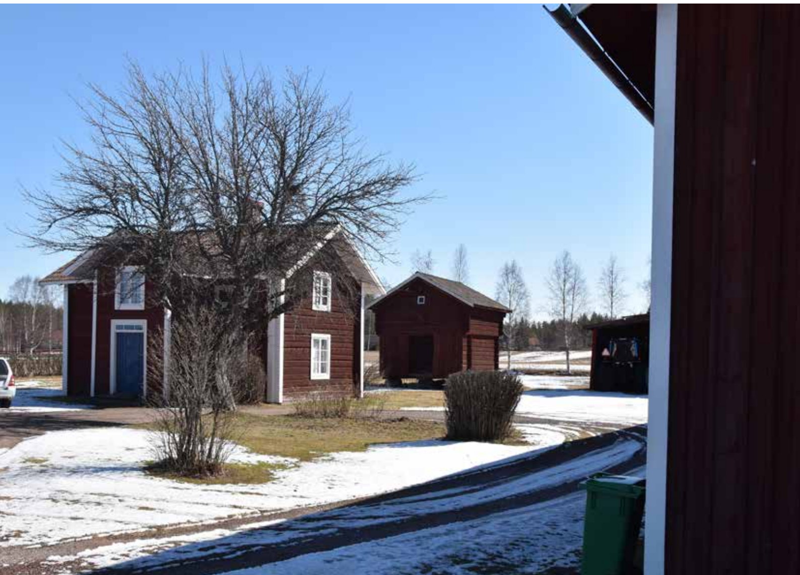
I Heden är bebyggelsen koncentrerad kring bygator vid två dammar. Vy mot Brömsdammen från söder. Heden 30:3.