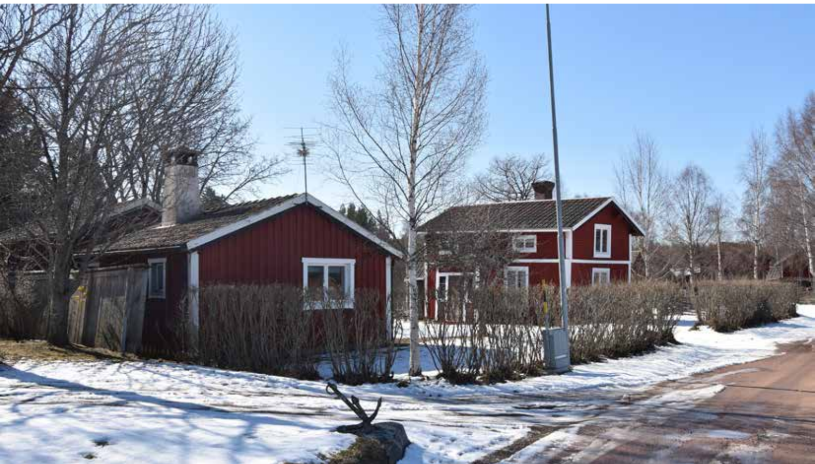
Många av de äldre husen i Heden är sidokammarstugor. En sidokammarstuga igenkänns ofta på att ingången leder rätt in i ett stort kök, som i sin tur leder in i en kammare på sidan. Sidokammarstugor har ofta en påbyggd farstuvist mitt fram på byggnaden, medans ingången till en enkelstuga ofta är på ett hörn. Heden 25:2.