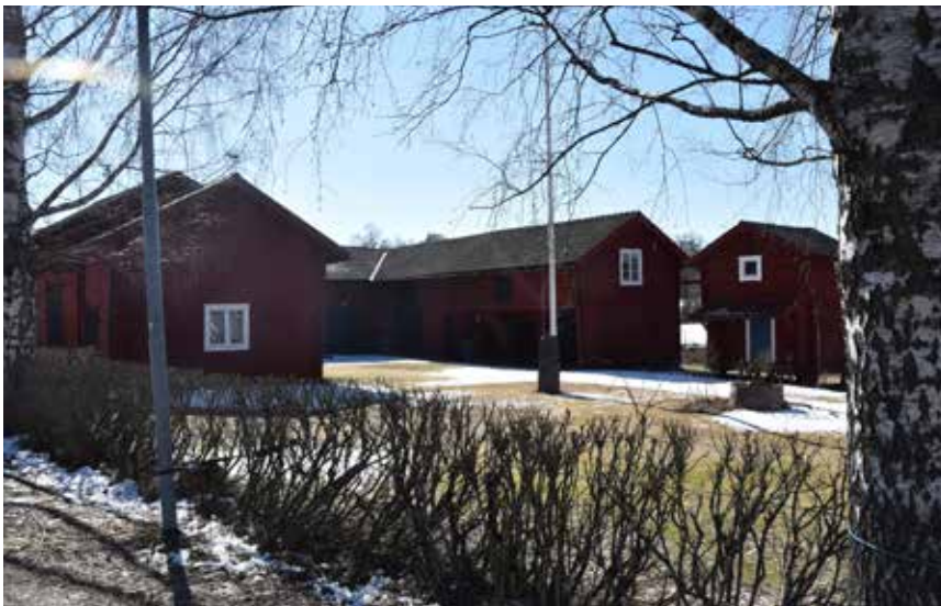
Kringbyggd gård med äldre ekonomibyggnader som är bevarade. På gården finns även en ovanligt stor sidokammarstuga i två våningar, men som delvis förändrats på senare tid. Heden 3:5.