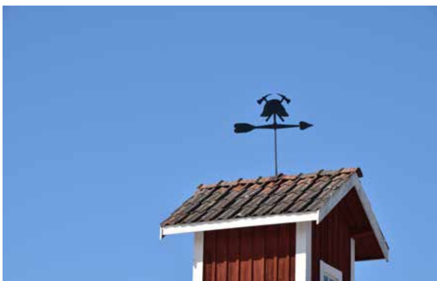
Karaktäristisk vindflöjel på byns brandstation. Byggnader så som brandstationen kan berätta mycket om livet i byn under äldre tider. Heden 4:21.