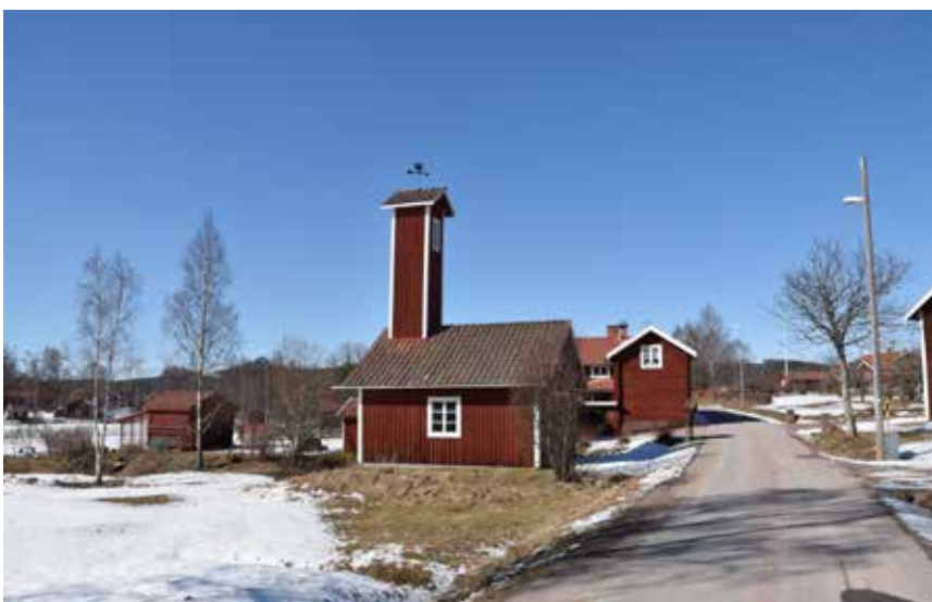
Byns brandstation är karaktäristisk och kan berätta om byggeskapen och byns gemensamma angelägenheter i äldre tider. Heden 4:21.