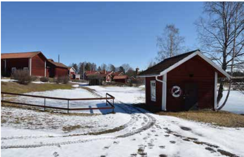
Tvättstuga vid Brömsdammen. Byggnaden är karaktäristisk och kan berätta om vattnets och tvättningens betydelse i byns historia. Heden 1:16.