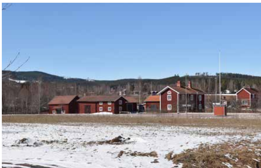
Kringbyggd gård med ståtlig parstuga och stora ekonomibyggnader invid landsvägen mellan Leksands-Noret och Järna. Heden 31:3.