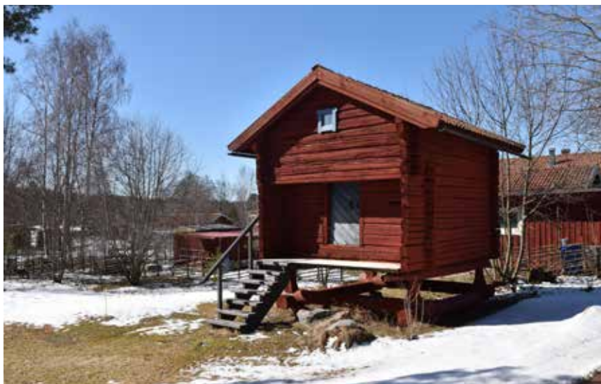
Gavelhärbre, sannolikt av hög ålder, i Lissheden. Heden 14:10.

Den 1900-talsbebyggelse som finns i den äldre bymiljön är företrädesvis inklädd i fäloröd panel och anpassad för byn. Formen på husen och detaljerna kan dock vara mer tidstypiska. På bilden syns ett hus som sannolikt uppfördes under 1930- eller 1940-talet. Heden 17:4.