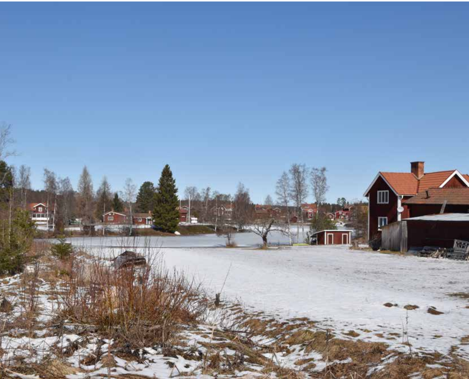
I Heden är bebyggelsen koncentrerad kring bygator vid två dammar. Vy mot Brömsdammen från söder. Heden 4:5.