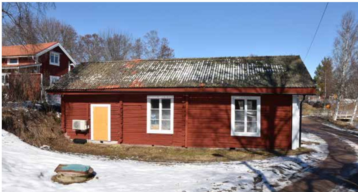
Missionshus invid Brömsdammen. Byggnaden har många välbevarade detaljer så som äldre fönster, dörrar och dörromfattningar med profil. Heden 3:3.