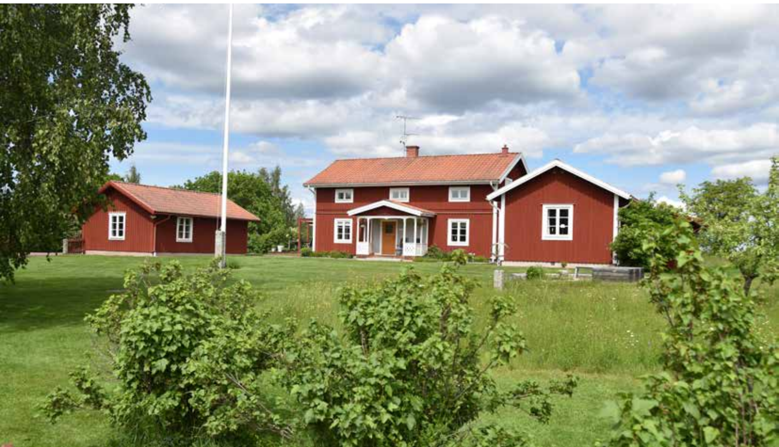
Exempel på nybyggd gård som sammansmälter väl bland den äldre bybebyggelsen. Heden 1:27.