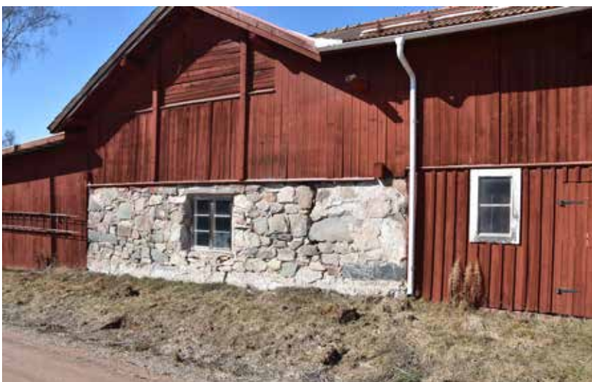
Fähus med värdefull äldre gjutmur. Heden 4:23.