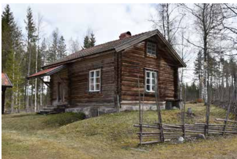
Välbevarad enkelstuga med stensatt källare och skärmtak. Hjortnäs 13:10.