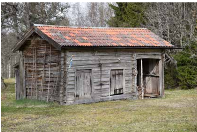
Fäboden består främst av långsmala byggnadskroppar med ofärgat naturligt grånat timmer. Hjortnäs 4:9.