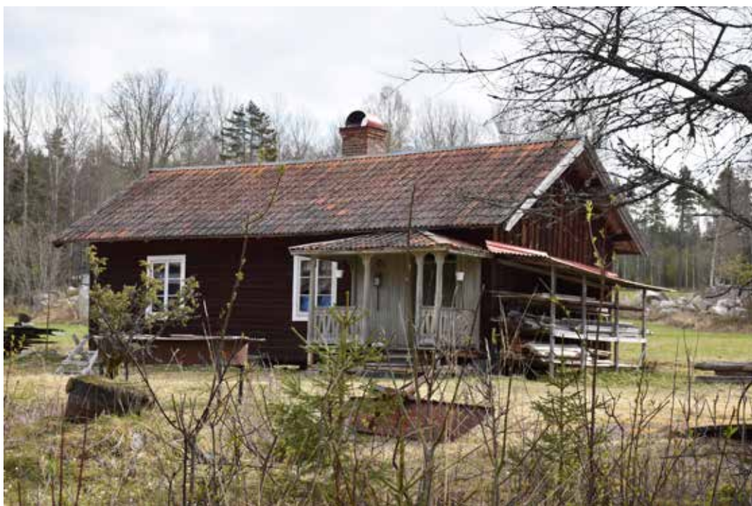
En ovanligt stor bostad för Axmors fåbodar, troligen en så kallad sidokammarstuga. Den utförliga farstubron är av en typ som vanligen förekommer på större bofasta gårdar. Tällberg 3:23.