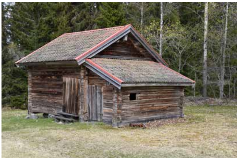
Mindre loge med tillhörande bod på fastighet Hjortnäs 4:9.