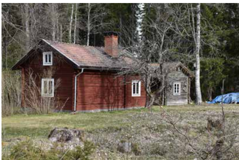
Rödfärgad enkel- eller sidokammarstuga. Fönstren har bytts under 1900-talets senare hälft och har försatts med enkla rektangulära blyspröjsar. Hjortnäs 14:9.