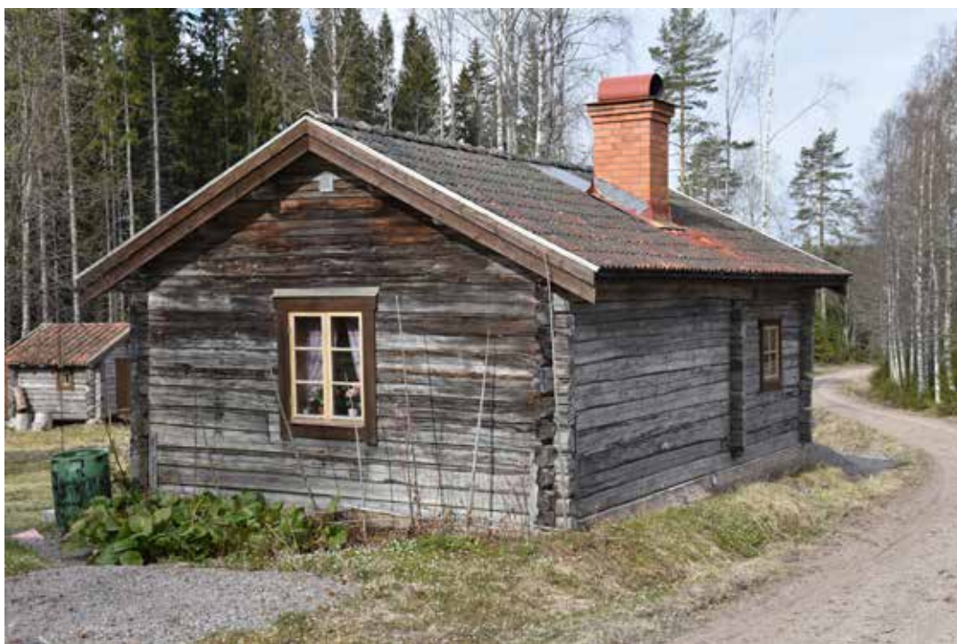
Bebyggelsen i Axmor präglas av långsmala och låga byggnadskroppar. Nästan alla byggnader är timrade med ofärgade naturligt grånat virke. Båda exemplen ovan är från fastigheten Tällberg 20:21.