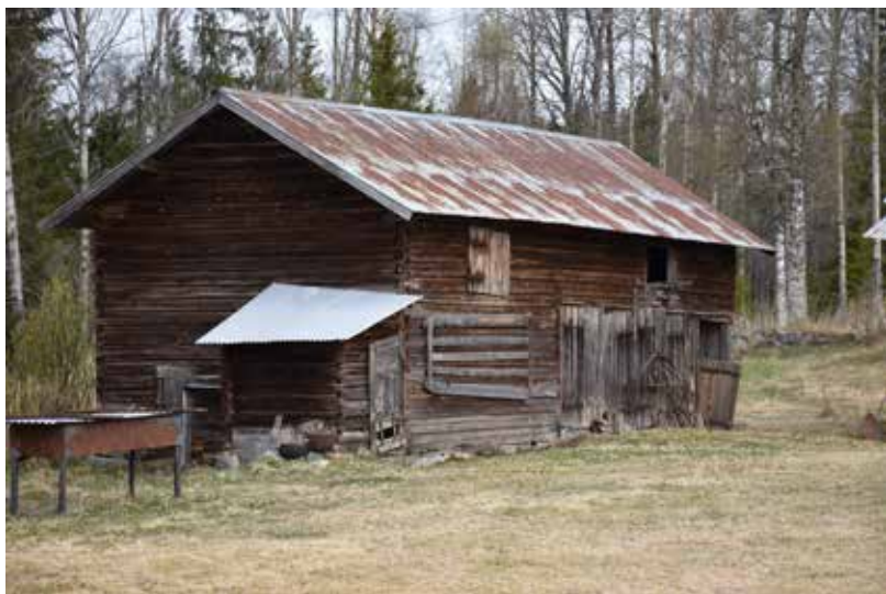
Fäboden har flera stora ekonomibyggnader, vanligen i form av hölador eller andra förrådsbodar. Båda byggnaderna ovan bär spår av tidigare rödfärgade knutkedjor och vissa andra rödfärgade detaljer. Tällberg 3:23.