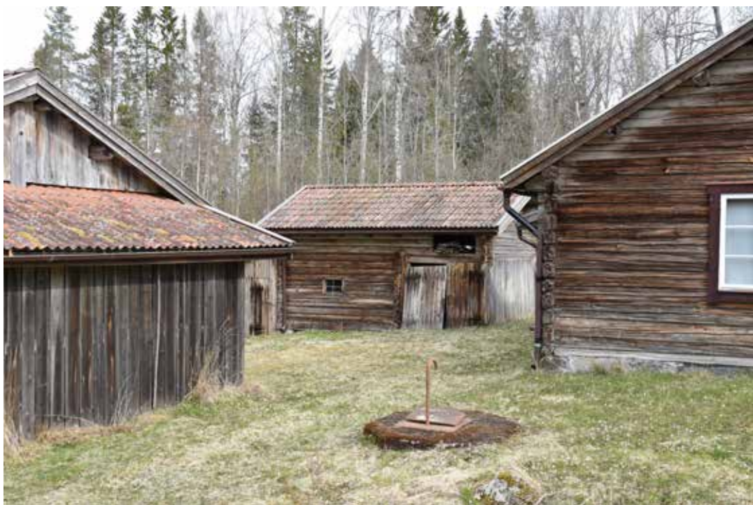
Kringbyggd och väl sammanhållen gård bestående av ett bostadshus till höger samt tillhörande lador och uthus. Båda exemplen ovan är från fastigheten Sättra 15:25.