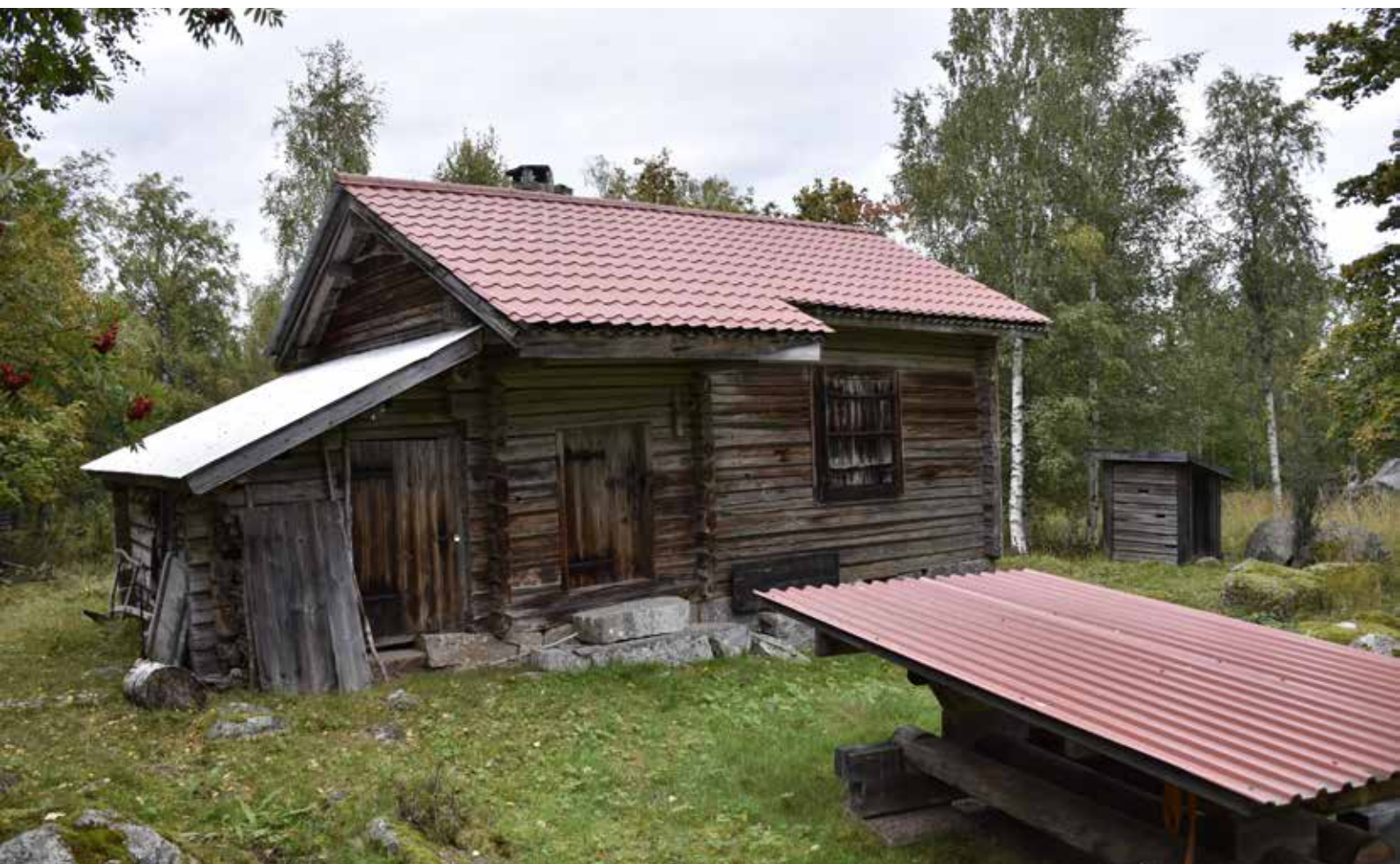
Ålderdomlig fäbodstuga i timmer med välbevarade äldre dörrar och fönsterluckor. Hedby 22:6.