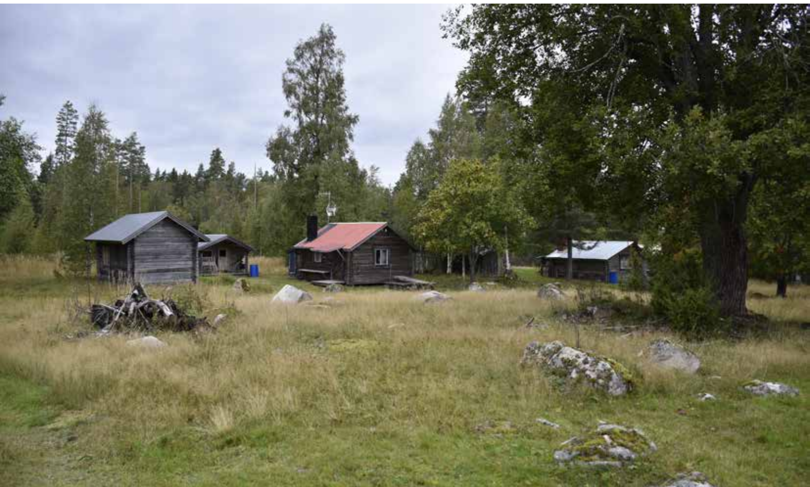
Fäbodgård där byggnaderna uppförts eller konverterats till fritidshus under 1900-talet. Djura 12:15.