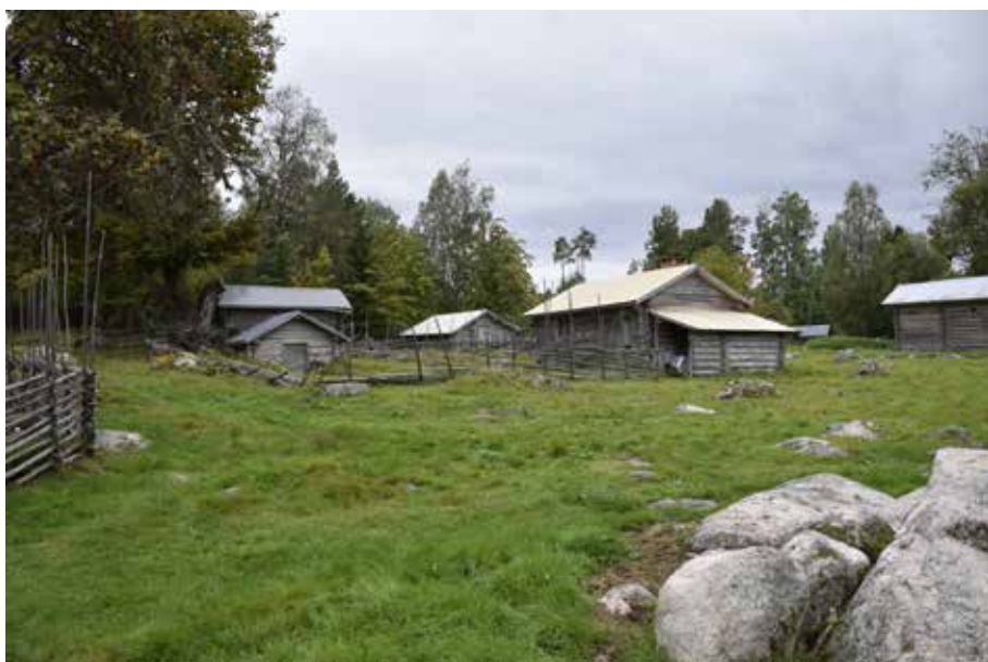
Nästan alla hus på fäbodstället är i timmer och naturligt grånade. Djura 35:13.