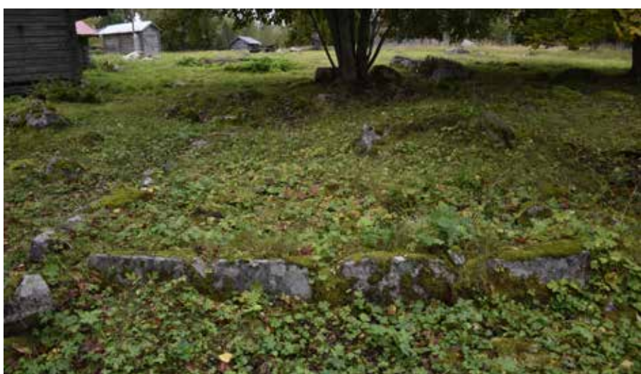
Gammal husgrund antyder placeringen av en nu försvunnen fäbodgård.