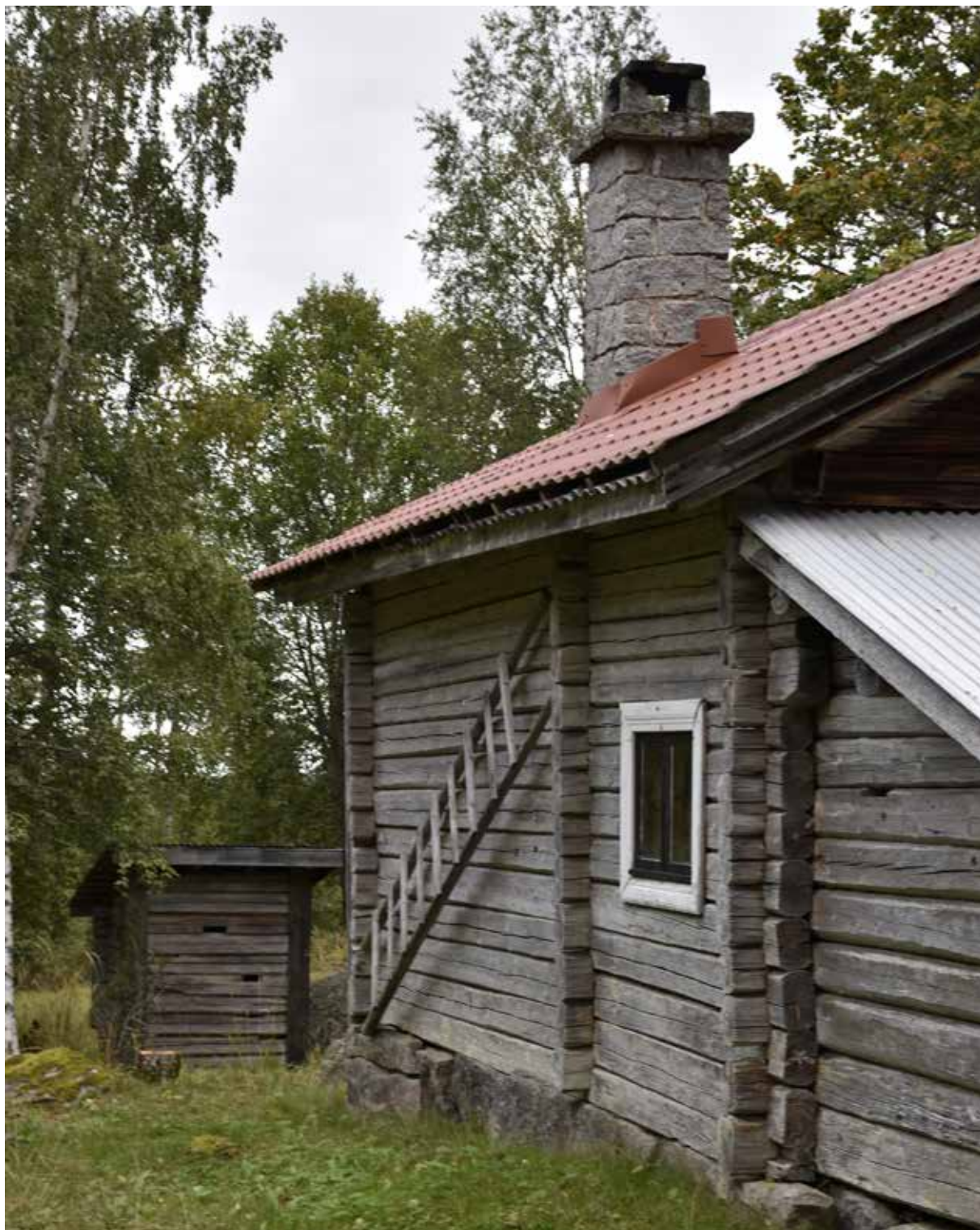
Fäbodstuga med skorsten i gråsten. Liknande skorstenar är vanliga i Järna socken, men inte i Leksand. Hedby 22:6.