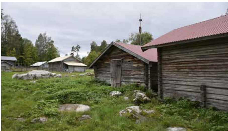
Flera av fäbusen på fäbodstället står med öppningen mot fägator och fätorg. Djura 3:4.