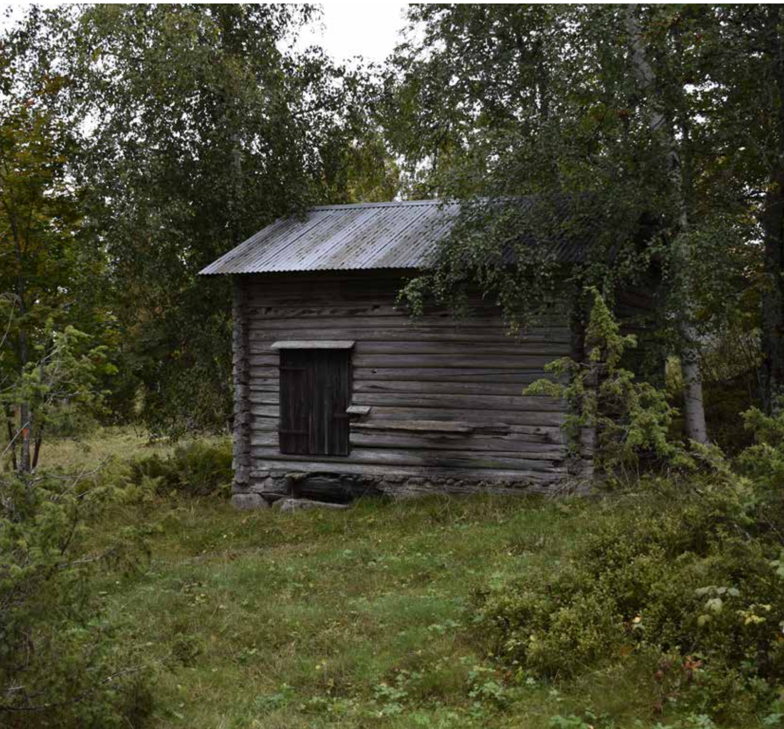
En timrad lada av hög ålder på norra delen av fäbodstället. Liknande byggnader är omistliga källor till kunskap om timmerbuskulturen i äldre tider. Hedby 24:7.