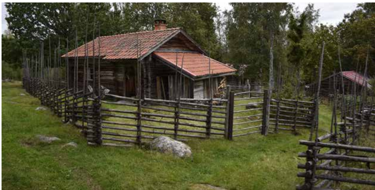
Karkatäristisk välbevarad fäbodstuga med som är typisk för Bjönnerberget. Stugan står på ett inhägnat gårdstun. Runt om finns fägator. Djura S:18.