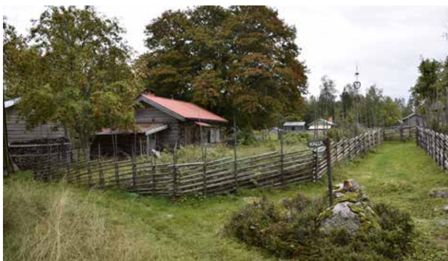
Fägator inhägnade med gärdesgårdar. På fäbodstället finns också, som skimtas mitt i bilden många storvuxna lövträd. Hedby 22:6.