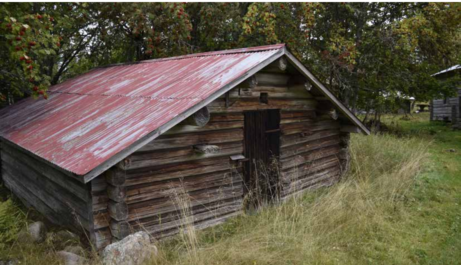
Ålderdomligt timrat fähus i en våning. Liknande fähus var vanliga även i byarna i äldre tider, men har allt sedan 1800-talet senare hälft blivit allt mer ovanliga. Djura S:13.