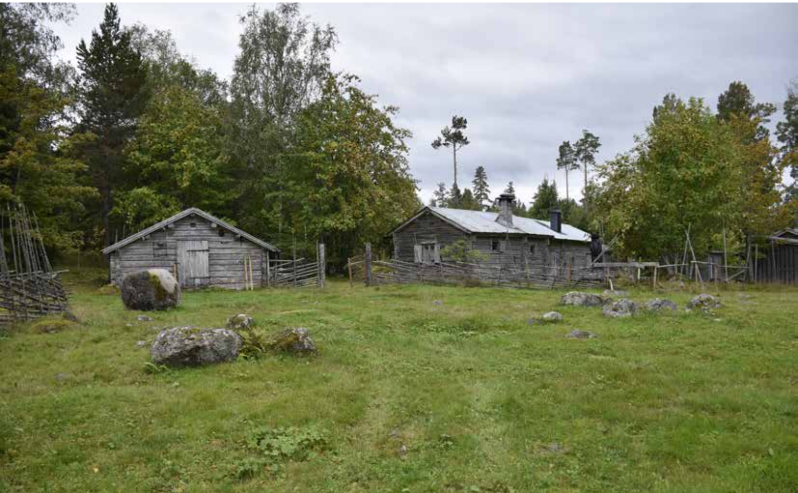
Fäbodstuga i två sektioner med grästensskorsten på fäbodgård i söder. Till vänster finns ett ålderdomligt fähus med öppning mot fätorget. Djura 48:4.