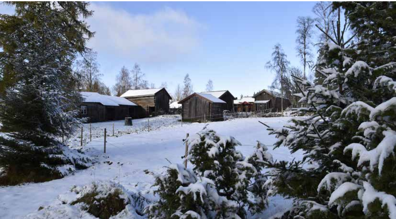
Mitt på fäbodvallen står en tätt bebyggd grupp om tre gårdar med en mångfald av ålderdomliga timmerhus som tillsammans bildar ett särskilt karaktäristiskt och ålderdomligt bebyggelseområde. Fastigheterna Västanvik 91:1 och Västannor 37:3.