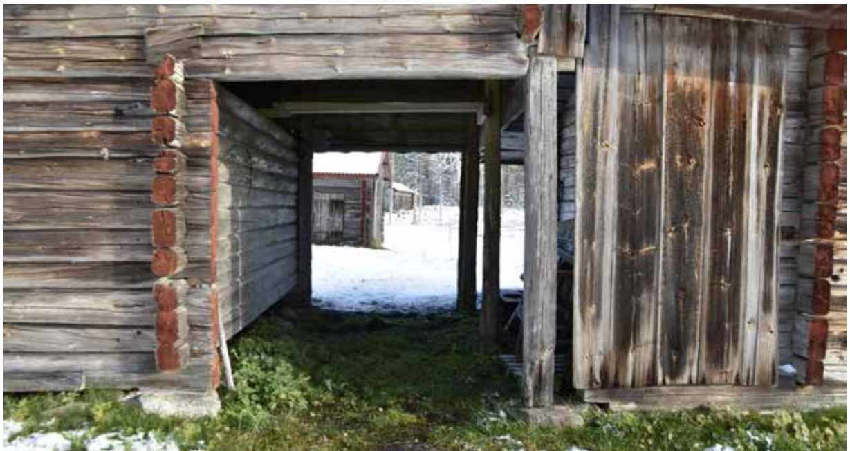
Portlider som leder in till gårdstunet för fäbodgården på fastigheten Västanvik 91:1.