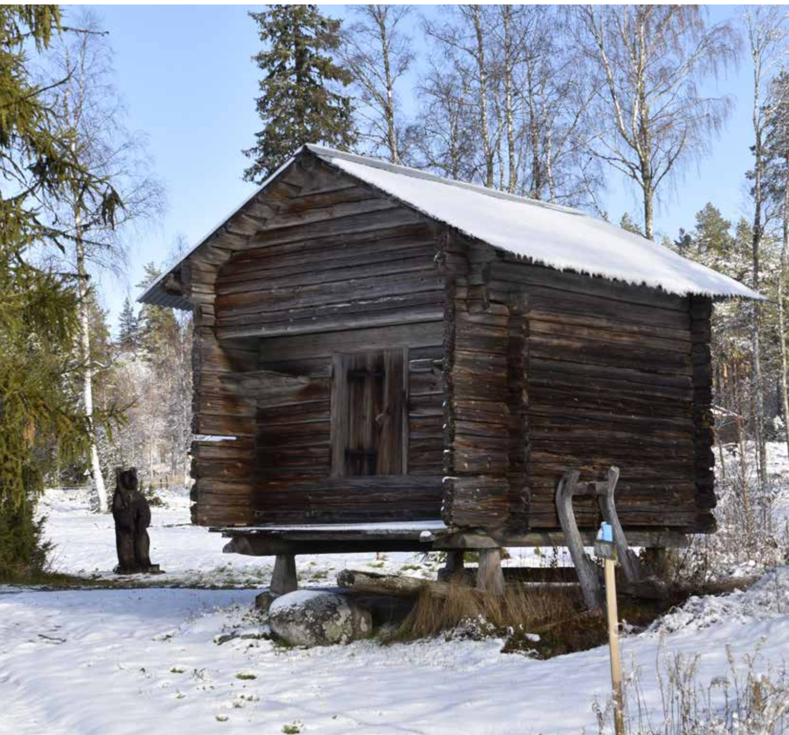
Ålderdomligt härbre med laggtak beläget på fastigheten Hagen S:1, vid Bortas torg. Laggtaket (undertaket) är ett tecken på hög ålder.