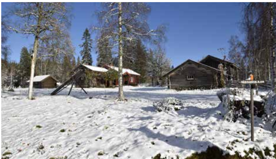
Hans-Erkers, nuvarande Trotzigs, en fäbodgård som tidigt blev sommarnöje men där det än idag finns bevarat ett ålderdomligt timrat fäjs. Västannor 37:3.