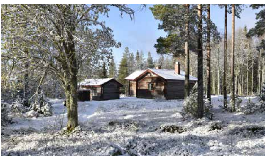
Kringbyggd fäbodgård på den västra delen av Granberg. Söder Bergsäng 33:II.