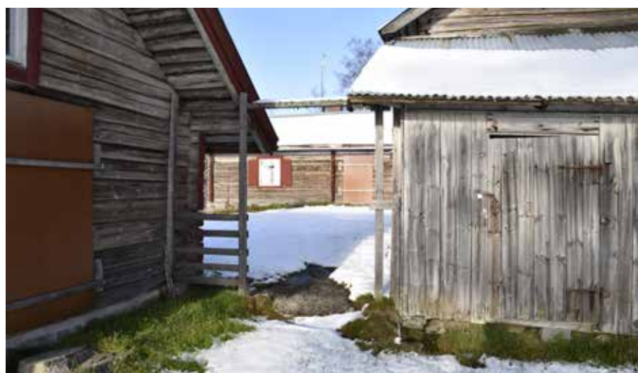
En av de äldre fäbodgårdarna är kringbyggd med fyrkantig form, vilket är utmärkande. Hagen 12:37.