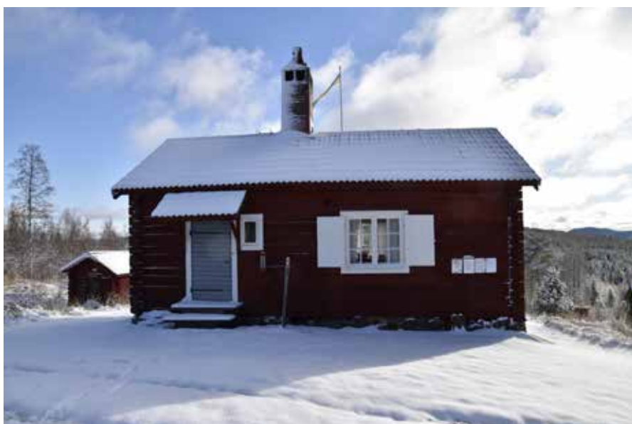
Ovan, Kronstugan med den milsvida utsikten söderut i bakgrunden. Byggnadens kronskorsten avtecknar sig karaktäristiskt över horisonten. Hagen S.I.