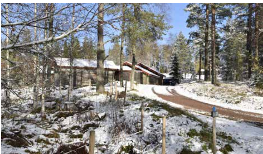
Fäbodgård vid Brudbackens fot. På gården finns bland annat ett ålderdomligt timrat fähus bevarat. Hagen 4:14.