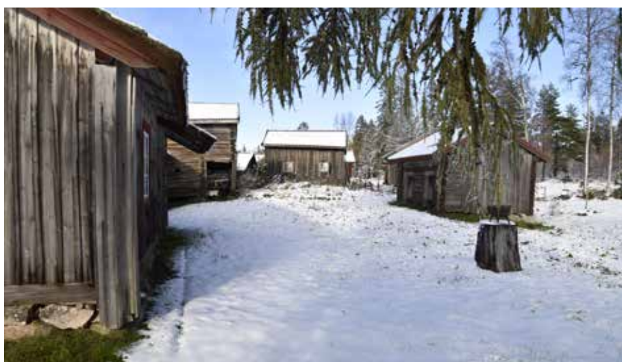
Kringbyggd fäbodgård där fäbodstugan är ställd i länga med stall och portlider. Väst- anvik 91:1.