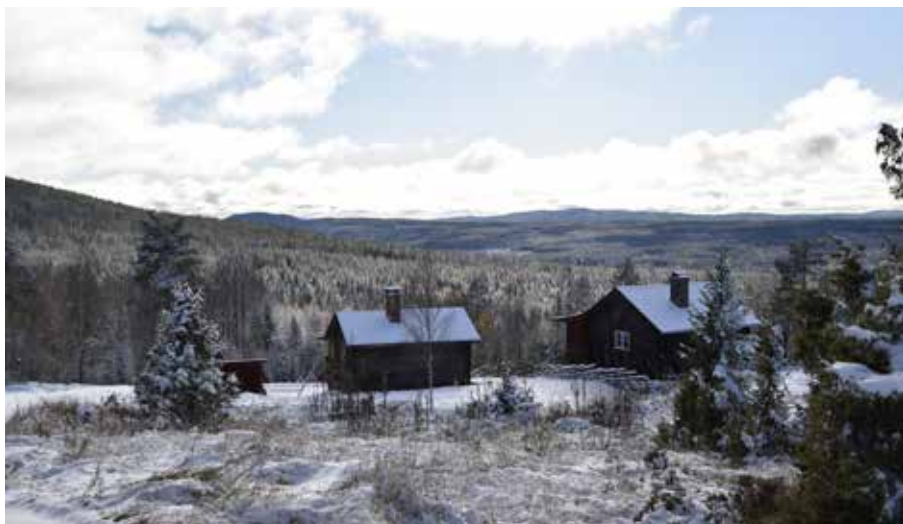
Den milsvida utsikten söderut från fäbodstället. I förgrunden syns nyare tillkomna fritidshus.